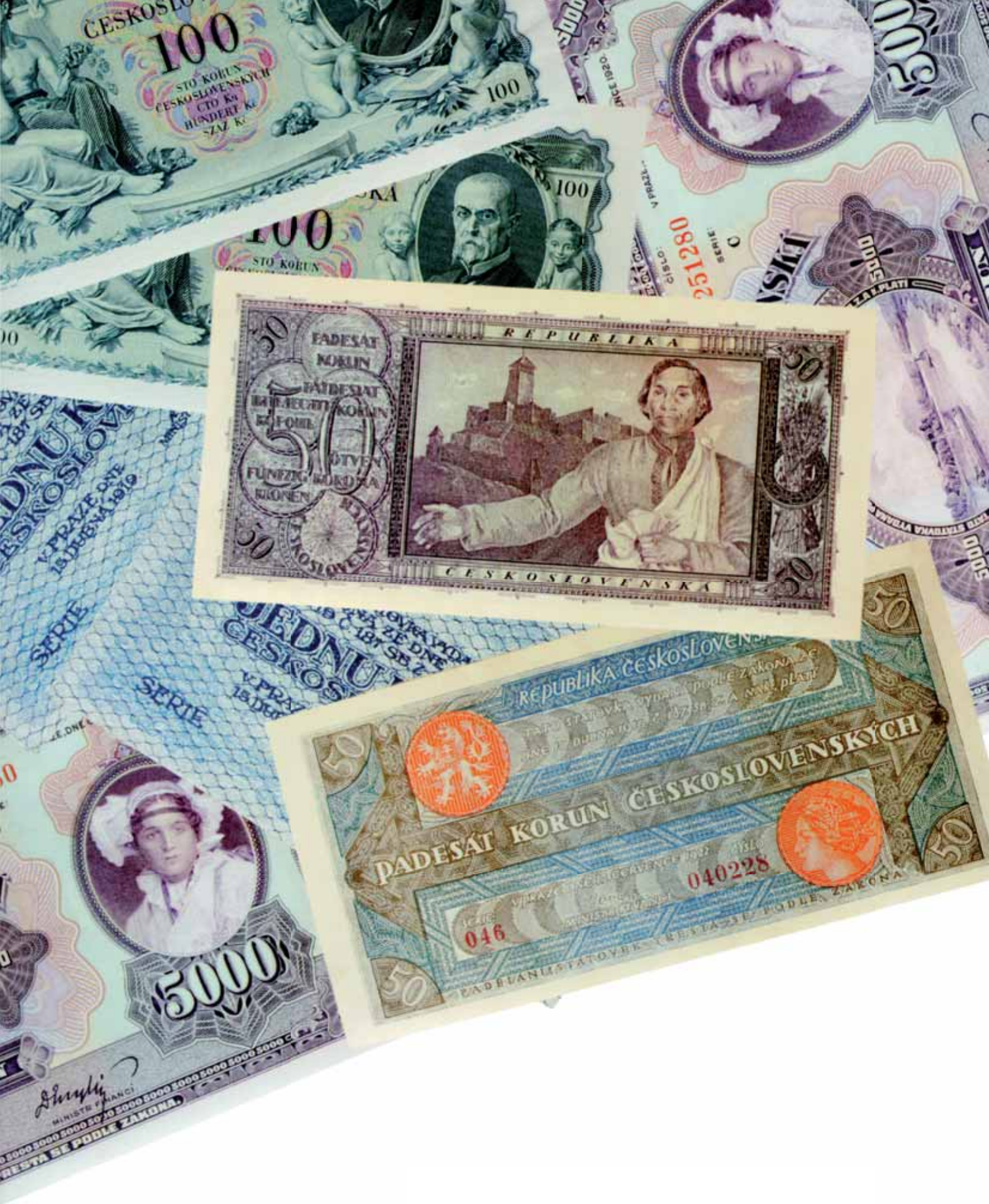
Připravujeme pro Vás aukci na jaro 2012 - Papírová platidla